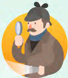
Vivencias, experiencias investigativas y trabajos comunitarios desarrollados