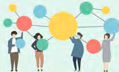
Los vínculos humanos